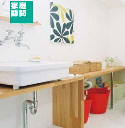
トイレ洗面脱衣スペースのオープン使いはひとり暮らしの醍醐味