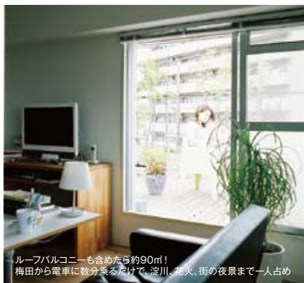
ルーフバルコニーも含めたら約90㎡！ 梅田から電車に数分乗るだけで、淀川、花火、街の夜景まで一人占め