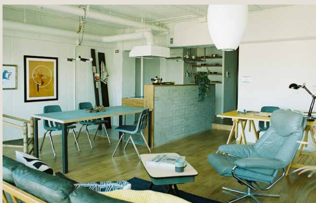
当社でリノベーションされたイメージ例